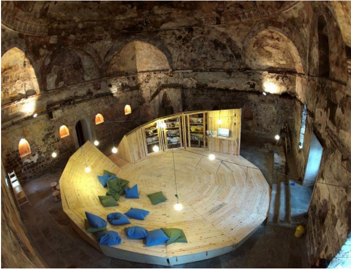
Fig. 7. CON|Temporary Library, Plovdiv, Bulgaria. Vista generale < www.studio812.eu > [30/12/2016].

originari, agendo, cioè sull'oggetto che va trasformato e non sull'uso che potrebbe essere adattato ad esso, comportando spesso grandi sacrifici in termini di materia e di immagine. In altri termini, la prassi più diffusa concepisce l'uso dell'architettura antica come trasformazione della realtà materica della fabbrica e non come modificazione dei modi d'uso senza mutamento, come in realtà spesso sarebbe possibile 28 .