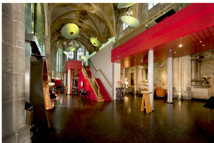
Fig. 1. Kruissherenhotel, Maastricht. Vista della navata centrale dell’ex chiesa della S. Croce (XV sec.).

Esiste quindi una molteplicità di usi, variabili nel tempo, storicamente leggibili e attuabili attraverso la sensibilità contemporanea con un atto di riflessione che non può – e non deve – restituire ciò che un tempo è stato, ma che può dare un nuovo senso al modo attuale di percepire il passato. Le architetture del passato, s’inseriscono nella realtà contemporanea attraverso le nuove attività svolte al loro interno, suggerendo a chi ne fruisce, scenari e immagini appartenenti a contesti sociali e culturali del passato; in essi, certamente, la ‘forma’ non coincide con il ‘contenuto’, ma è proprio questo