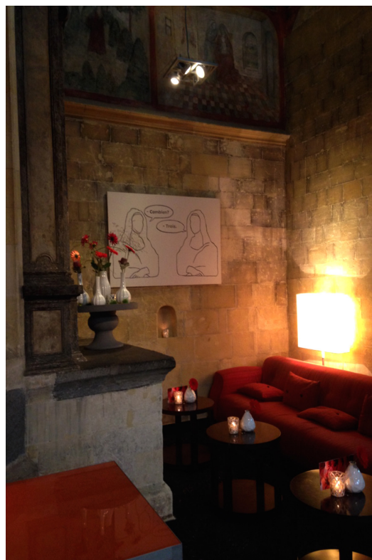
Fig. 2. Kruissherenhotel, Maastricht. Particolare della navata laterale.