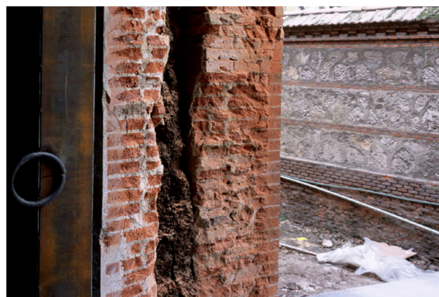
Fig. 6. Matadero, Madrid. Particolare.