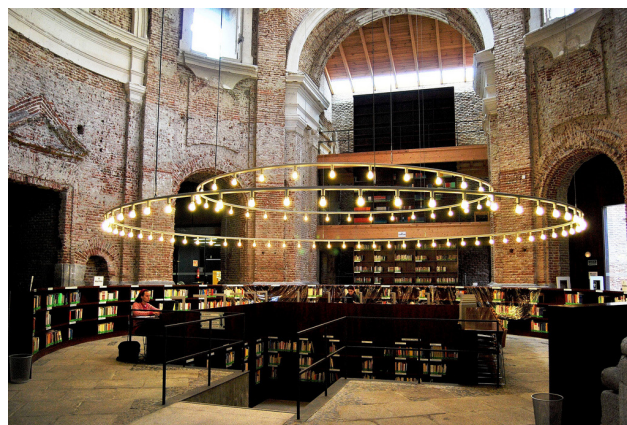
Fig. 4. Cultural Centre of the Piarist in Lavapiés, Madrid. Particolare del coro < www.linazasorosanchez.com > [30/12/2016].

Il progetto di conservazione, secondo una nota definizione di Amedeo Bellini, è "l'esecuzione d'un progetto d'architettura che si applica ad una preesistenza, compie su di essa tutte le operazioni tecniche idonee a conservarne la consistenza materiale, a ridurre i fattori estrinseci di degrado, per consegnarla alla fruizione come strumento di soddisfazione dei bisogni, con le alterazioni strettamente indispensabili, utilizzando studio preventivo e progetto come strumenti d'incremento della conoscenza" 24 . Oltre alla conservazione della "consistenza materiale" dell'architettura, ossia la fisicità degli elementi che la compongono nella loro autenticità, Bellini include altre due finalità del progetto: da un lato quella di