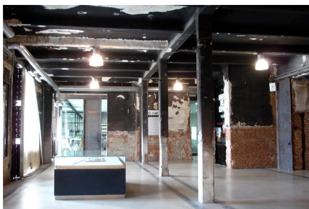
Fig. 5. Matadero, Madrid. Vista generale.

Giancarlo De Carlo ha evidenziato come alcune fabbriche, nel corso dei secoli, siano riuscite ad adeguarsi a nuove funzioni, spesso molto diverse da quelle originarie, indicando questa vitalità con il termine “riverberazione”. Com’è noto, De Carlo, sosteneva che dovesse essere l’architettura ad “adattarsi agli uomini e non il contrario” 27 . In effetti, va rilevato che il nuovo uso di un’architettura esistente, venga concepito quasi sempre come adattamento di una forma a contenuti diversi da quelli