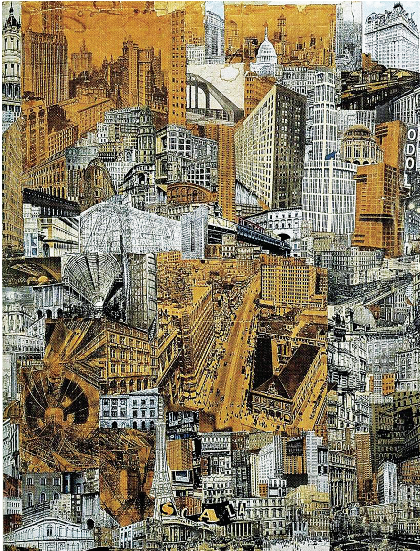
Paul Citroen, Metropolis, 1923