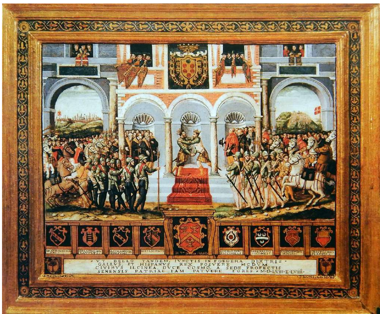
5: L'abbraccio tra Filippo II di Spagna ed Enrico II di Francia, 1559 [Siena, Archivio di Stato, Biccherna, 63. Da Le Biccherne di Siena 2002, 229].