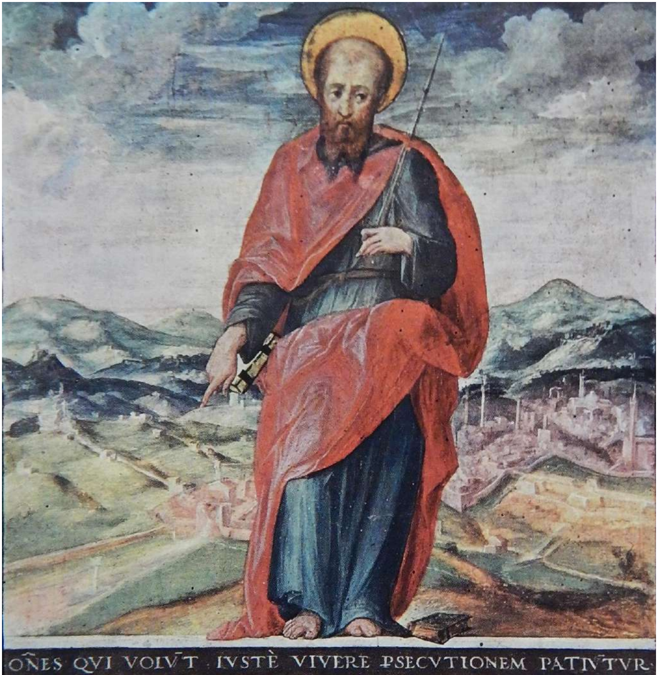
4: San Paolo conforta i Senesi nelle tribolazioni dell'assedio , 1555 [Siena, Archivio di Stato, Biccherne, 60. Da Le Biccherne 1984, 251].

rifornirsi avendo perso progressivamente il controllo delle principali vie di comunicazione, quindi ridotta alla fame. La resa fu firmata il 17 aprile del 1555 e concordata con Cosimo I intenzionato ad arginare la presenza francese in Toscana. Un finale che giustifica la composizione della tavoletta del 1555 San Paolo conforta i senesi nelle tribolazioni dell'assedio , in cui la triste espressione del santo e il versetto "OMNES QUI VOLUNT IUSTE VIVERE PERSECUTIONEM PATIUNTUR" sintetizzavano il sentire dei senesi (fig. 4). Alle spalle dell'apostolo è la città vista da nord, in cui si riconoscono ancora i profili delle fortificazioni aggiornate erette a integrazione delle mura medievali.