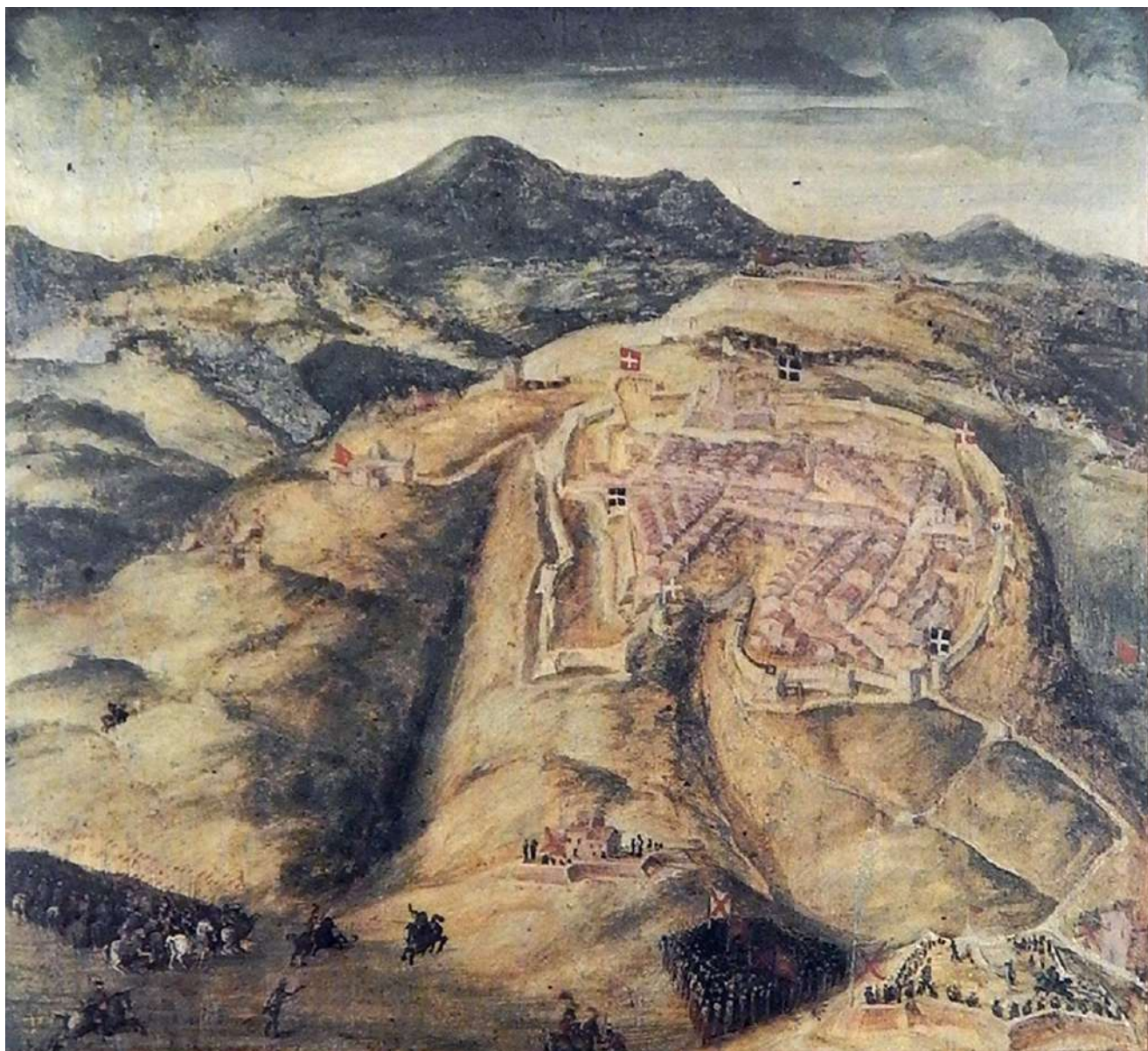
3: L'assedio di Montalcino, 1553 [Siena, Archivio di Stato, Biccherne, 49. Da Le Biccherne 1984, 249].

1555 [Pellegrini 2012b]. Successive e convulse azioni coinvolsero alcune località intorno a Siena, alternativamente conquistate dalle truppe alleate o dai nemici in più tentativi di accerchiamento o di spostare il campo di battaglia su altri fronti.