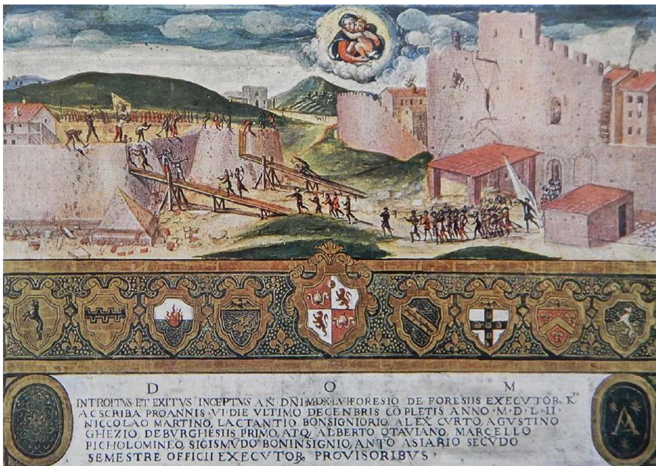
2: La demolizione della fortezza spagnola, 1552 [Siena, Archivio di Stato, Biccherne, 58. Da Le Biccherne senesi 1964, 147].

profusi presentava criticità evidenziate da Giovan Battista Belluzzi nella relazione redatta per Cosimo I [Pepper, Adams 1986; Lamberini 2007, I, 90-124]. Le difese resistettero nonostante l'inferiorità numerica degli assediati, la vulnerabilità delle fortificazioni, i danni arrecati dalle artiglierie nemiche documentati in un disegno conservato al Gabinetto Disegni e Stampe degli Uffizi di Giovan Battista Pelori 9 e nell'incisione che ritrae l'assedio pubblicata da Maggi e Castriotto [Maggi, Castriotto 1564, 104r-104v]. L'esito sarebbe stato certamente diverso senza i continui soccorsi inviati da Siena e se il timore di un possibile sbarco della flotta turca non avesse indotto gli assediati a lasciare il campo.