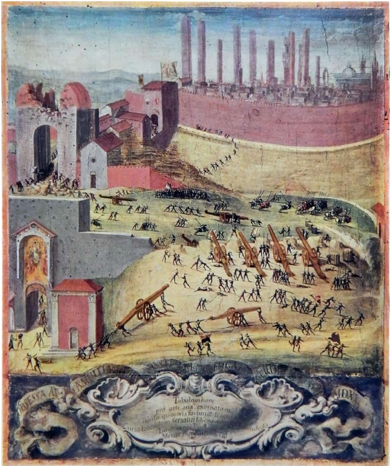
1: La vittoria di Camollia, 1526 [Siena, Archivio di Stato, Biccherne, 49. Da Le Biccherne 1984, 229].

distribuita su tre colli. Quell'artiglieria, come mostra la tavoletta, venne requisita e trasferita in città. Fu una vittoria, ma anche un monito per i governanti chiamati ad intervenire sulle mura