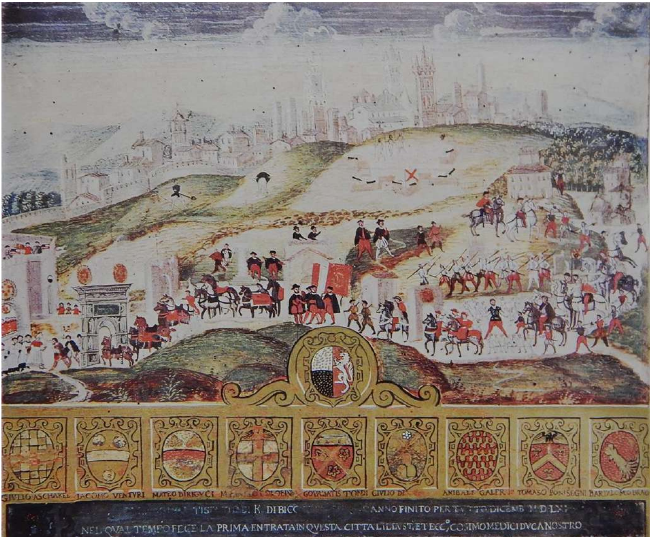
6: Solenne ingresso di Cosimo I in Siena, 1560 (?) [Siena, Archivio di Stato, Biccherna, 63. Da Le Biccherne 1984, 259].

La celebrazione dell'ingresso di Cosimo I a Siena il 28 ottobre 1560, conclude la serie iconografica di questa infausta parabola della storia di Siena (fig. 6). L'accoglienza al nuovo signore, commemorata da resoconti e "memorie", fu esaltata dalla costruzione di un fastoso