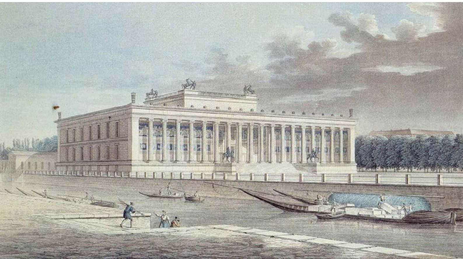
Figura 3. Friedrich Alexander Thiele, Veduta prospettica dell'Altes Museum a Berlino di Karl Friedrich Schinkel, 1830, acquaforte colorata.