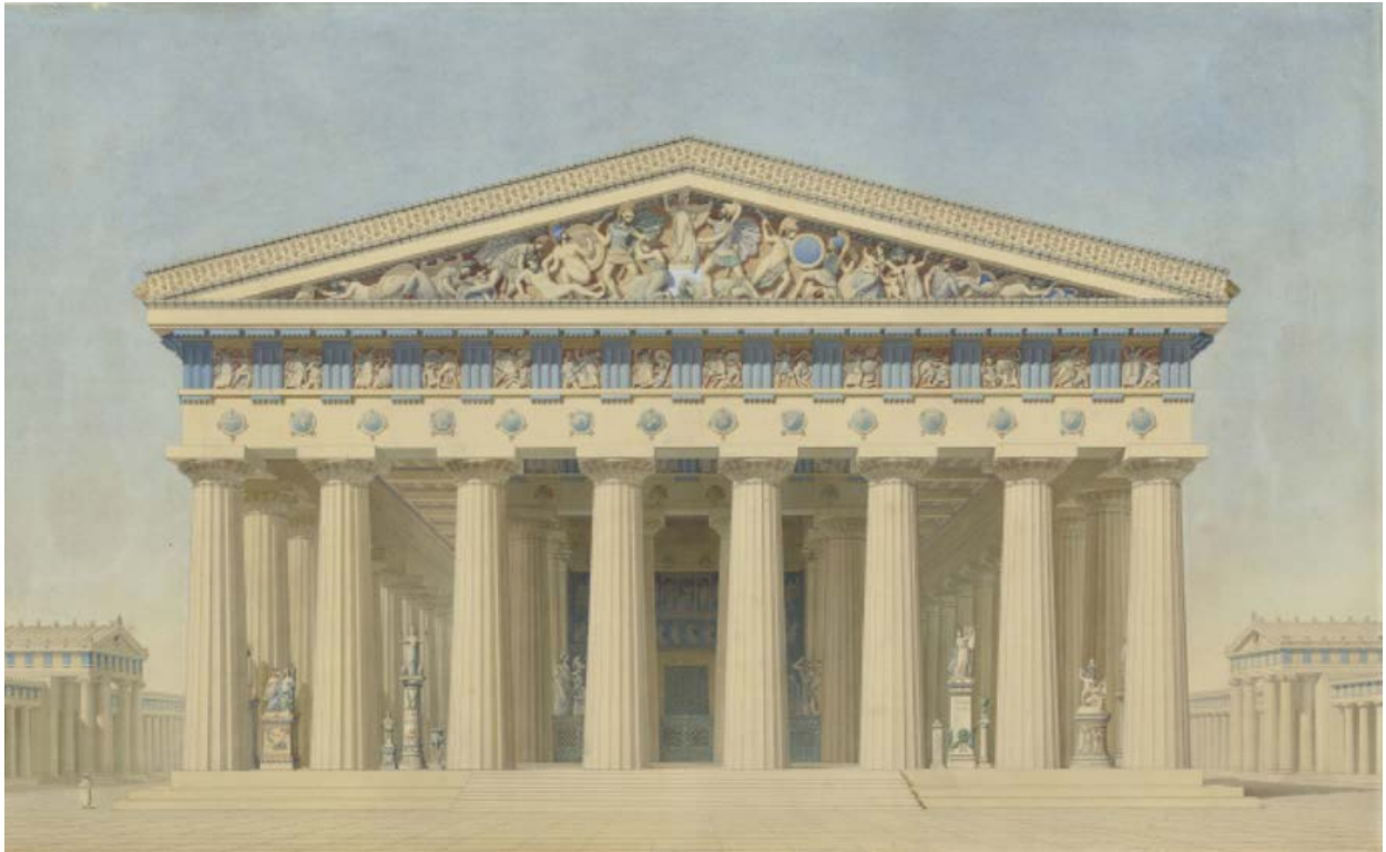
Figura 4. Jaques Ignace Hittorff, Temple T à Sélinonte (Sicile) , élévation restituée de la façade principale, ante 1859, penna e inchiostro nero, acquerello su carta, Paris, RMN-Grand Palais (Musée d'Orsay).