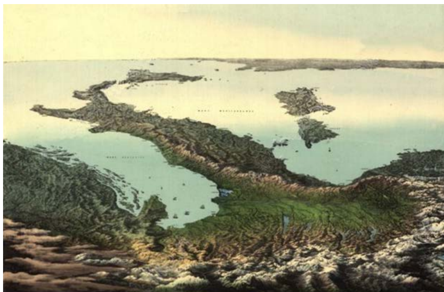
Figura 1. L'Italia vista dalle Alpi, litografia a colori, 1853.

Gli architetti del tempo giunsero però relativamente tardi in Sicilia rispetto ai letterati e ai pittori, dando comunque forza a un dibattito approfondito grazie agli scambi con archeologi e intellettuali francesi, inglesi e tedeschi, oltre che siciliani 1 .