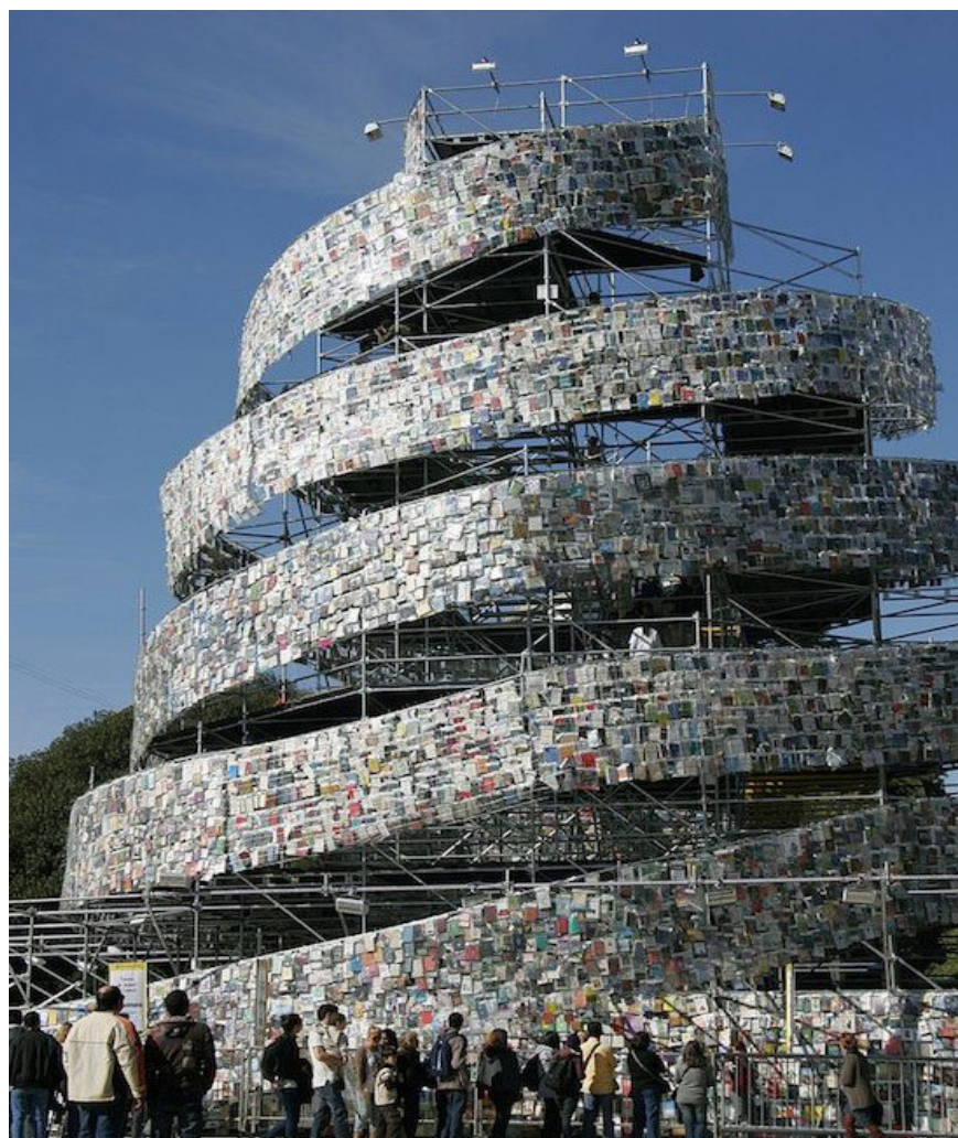
Fig. 1 - Torre di Babele di libri a Buenos Aires, 2011 / Babel books tower in Buenos Aires, 2011 (Source: https://www.wikiwand.com/es/D%C3%ADa_Internacional_del_Libro ).

Riferendo questo alla scala dell’ambiente costruito, il quadro terminologico