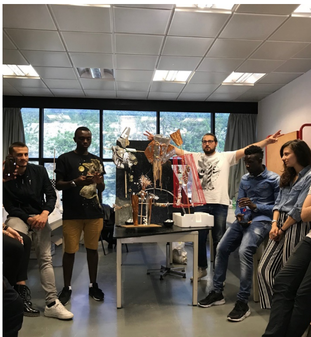
Fig. 5 Laboratorio MeLANinE Workshop Le Sentinelle Fluttuanti, Università Mediterranea di Reggio Calabria.