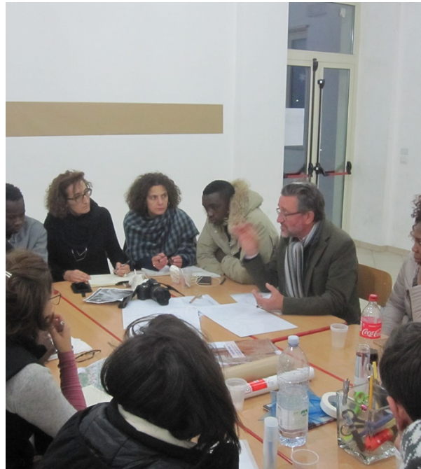
Fig. 3 Laboratorio MeLANinE Patri(monio)/Paesaggio, tavolo di studio.

nuova condizione culturale ma anche fisica.