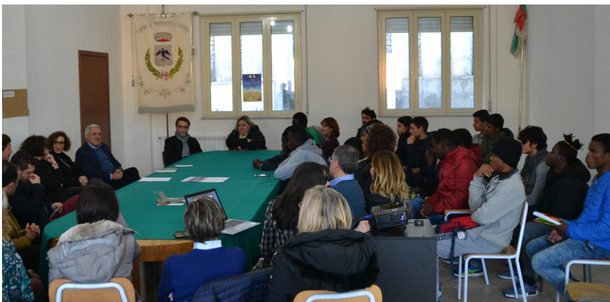
Fig. 4 Laboratorio MeLANinE Patri(monio)/Paesaggio, incontro con le istituzioni politiche e scolastiche, la comunità locale e i cittadini stranieri ospiti delle strutture di accoglienza.