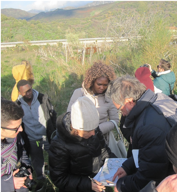
Fig. 2 Laboratorio MeLANinE Patri(monio)/Paesaggio, sopralluogo e analisi dell'area di progetto.