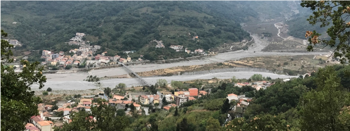
Fig. 1 Laboratorio MeLANinE Patri(monio)/Paesaggio, Valle del Patri, Sicilia, 2017 (foto di P. Raffa).

la rilevanza della cooperazione e di sostenere la rete dei servizi amministrativi ed educativi.