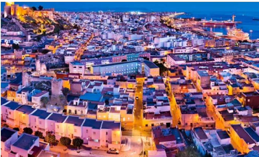
Figura 1 | Veduta panoramica di alcune aree della città di Almería, interessate dal progetto CAMINA.