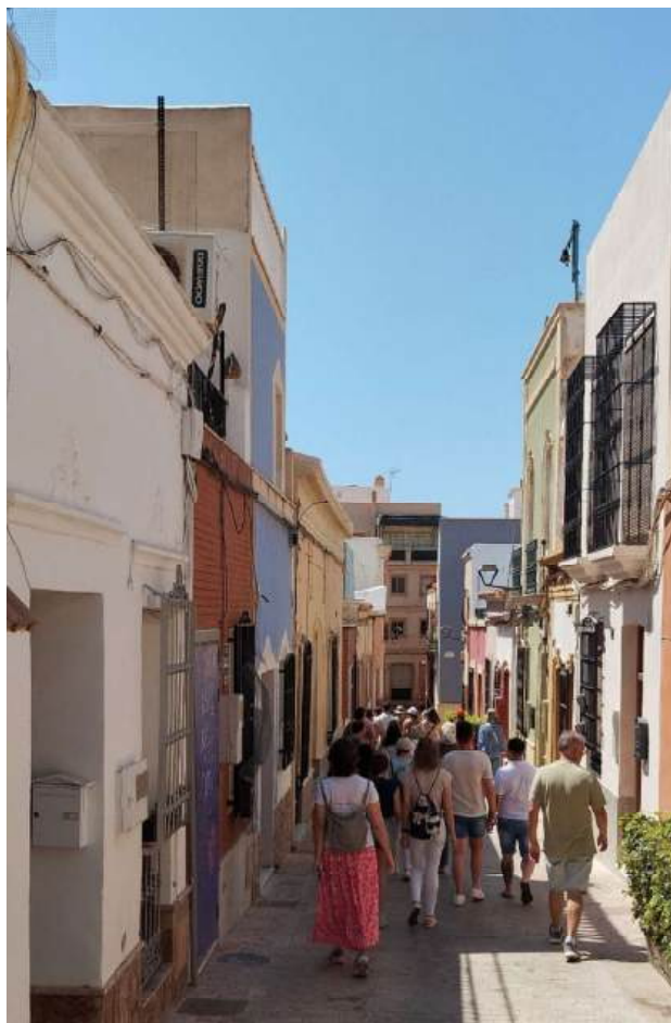
Figura 4 | Progetto CAMINA. Cultural walking nel quartiere di Almedina.

Grazie al grande impegno di coinvolgimento delle persone, CAMINA è riuscita ad attrarre persone in luoghi che, pur essendo patrimonio culturale della città, sono considerati emarginati e svantaggiati, luoghi in cui le persone non sono abituate a recarsi per paura o mancanza di informazioni. Ha così innescato un processo di de-stigmatizzazione dei quartieri interessati, favorendo l'inclusione sociale delle persone che vi risiedono. Il Comune di Almería, attraverso CAMINA, ha avuto l'opportunità di sperimentare nuovi approcci di implementazione del progetto che hanno permesso di innovare gli appalti pubblici, di implementare un approccio collaborativo di co-progettazione nell'intero sviluppo del progetto e di promuovere un nuovo modo di coordinare l'implementazione del progetto che facilita l'approccio partecipativo.