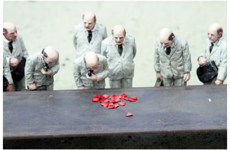
Figg. 17, 18 | Isaac Cordal: Walls enclosure, 2020; La comédie humaine, 2016 (copyright: I. Cordal).

tiva di portata uguale a quella di un 'quadrupe che impara a stare in piedi sulle zampe posteriori'. Responsabilità nell'accezione che ne dà Hans Jonas (1979) nell'affermare un'etica della cura e della conservazione del pianeta. Umanesimo infine, in accordo con Morin (1973) quando asserisce che abbiamo bisogno di un umanesimo rigenerato che attinga alle sorgenti dell'etica: la solidarietà e la responsabilità presenti in ogni società umana, essenzialmente un Umanesimo planetario.