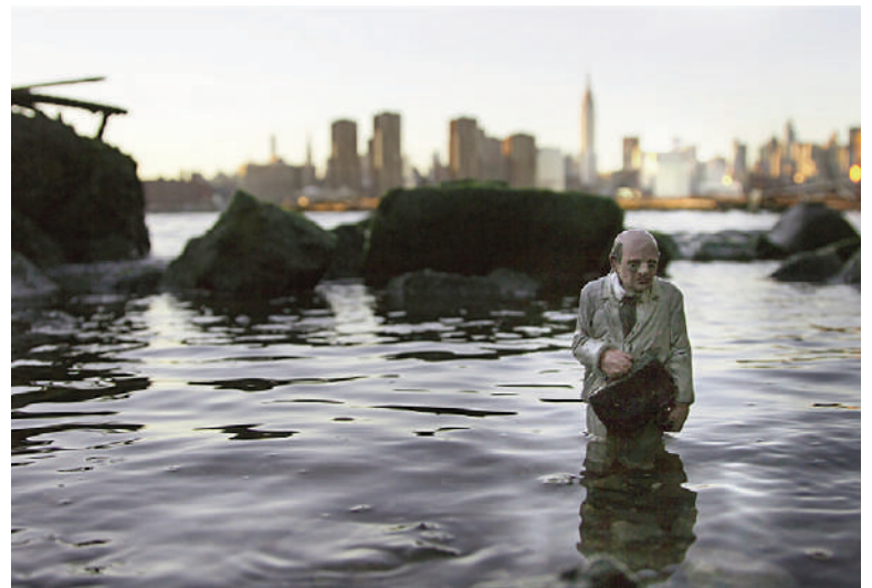
Figg. 9-12 | Isaac Cordal: Splash and burn, 2017; Slowly sinking, Ego Monuments, 2019; Splash and burn, 2017; Cement Eclipses, 2015 (copyright: I. Cordal).

che in quella di uso, gestione e fine vita. La manutenzione, l'aver cura – il ripensare in termini di 'seconda vita' – può rappresentare una speranza per il futuro stimolando a conservare, a ridurre lo spreco, a rendere sicure e vivibili le città, efficienti gli edifici e le infrastrutture, nel rispetto dell'ambiente e della vita umana (Cattaneo, 2012). Finalità espresse, ancora una volta con grande lungimiranza nel rapporto sui Limiti dello Sviluppo in cui si affermava che la cultura del mantenimento è l'unica alternativa allo sviluppo incontrollato delle attività produttive che porterà al disastro l'umanità (Meadows et alii, 1972).