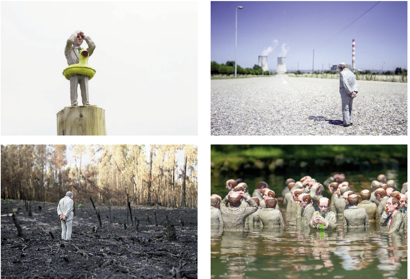
Figg. 5-8 | Isaac Cordal: Waiting for climate change, 2019; Creative camp, 2014; Estau, 2016; Follow the leaders, 2019 (copyright: I. Cordal).

La storia, al riguardo, insegna che progressi tecnologici e trasformazioni del pensiero scientifico hanno natura osmotica e complementare. Da sempre l'uno alimenta o innesca l'altro, e viceversa; insieme, a loro volta, attivano i diversi cambi di Paradigma. Oggi, alla transizione in atto fa da contraltare l'affermarsi della Quarta Rivoluzione Industriale. Klaus Schwab (2016) la descrive come fusione di tecnologie, che annullano i confini tra il fisico, il digitale e il biologico e fissa la data della sua genesi al 2014, anno in cui fu introdotta l'espressione 'the second age machine' per spiegare la rivoluzione che il mondo stava vivendo in relazione all'impatto delle tecnologie digitali (Brynjolfsson and McAfee, 2014). Una rivoluzione che assume in sé gli indirizzi programmatici di Agenda Digitale e delle politiche di Industria 4.0, le cui fondamenta sono l'Internet of Things (IoT), la robotica, i dispositivi connessi, i sistemi informatici fisici e la fabbrica 4.0, i cui caratteri connotanti, velocità, portata, impatto dei sistemi, stanno determinando cambiamenti dirompenti in tutti gli ambiti della vita e delle attività dell'uomo.