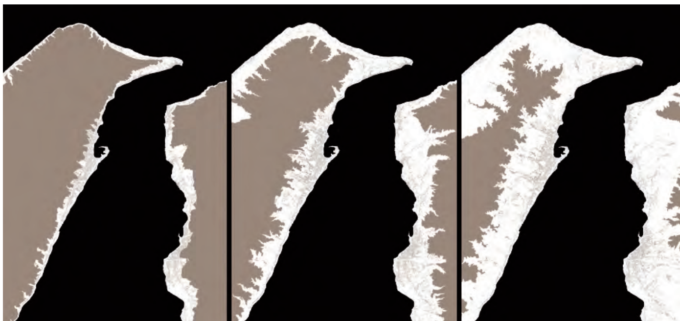
Fig. 1 - Sezioni orizzontali dell'Area dello Stretto 50, 100, 150 m slm [fonte Università Mediterranea di Reggio Calabria, Facoltà di Architettura, Laboratorio di sintesi finale Il progetto dell'Esistente e la Città Meridionale L'area dello stretto AA. 2004/2008, coordinatore Laura Thermes.

Descritta nelle proposte di piano da Giuseppe e Alberto Samonà, Ludovico Guaroni, Antonio Guistelli, Sergio Musmeci, Paolo d'Orsi Villani, Leonardo Urbani, l' Area dello Stretto delinea nei capoluoghi di Messina e Reggio Calabria, la prevalenza di una spazialità cartesiana ortogonale, reiterata nella metrica seriale del passo misuratore dell' isolato , disegnato nei piani della ricostruzione dei primi decenni del Novecento. Il conflitto della maglia regolare con le curve dei suoli individua le accensioni irregolari del tessuto come crocevia di inaspettate rotazioni, spesso irrisolte, nella dimensione insediativa. Fuori dai centri abitati, all' indurimento della stretta fascia compresa tra l'ergersi dei rilievi e il mare, fa da contraltare una importante presenza della natura, spesso schiva e incontaminata, appena al di sopra dell'area urbanizzata,