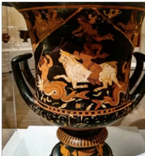
Cratere a calice pestano a figure rosse Prima Marilibu, J. Paul Getty Museum, 81, AE, 78, oggi Paestum, Museo Archeologico. Da Sant'Agata dei Goti.

Conferma la persistenza di questa lettura il cambiamento dell'iconografia che da un certo momento in poi muta la gestualità della fanciulla, trasformandola da seduta a fluttuante e nell'atto di spingere e guidare il toro, con un modulo che in qualche caso si affianca alla raffigurazione di Europa nuda, o con gli abiti scivolati giù da una spalla, in una progressiva accentuazione della carica erotica del tema del rapimento 15 .