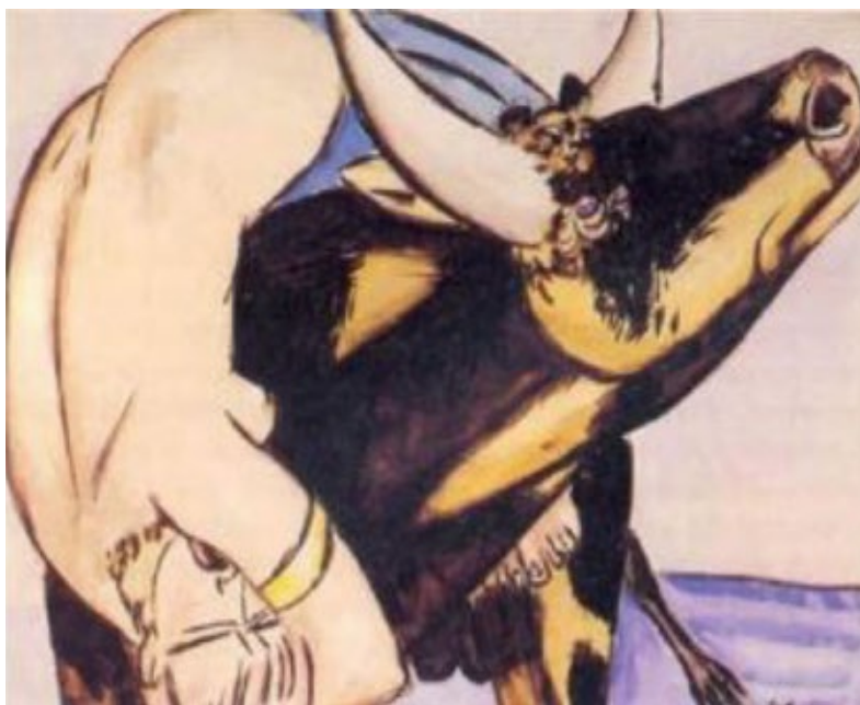
M. Beckmann, Der Raub der Europa , 1933.

Nel 1933, lo stesso anno in cui Hitler prese il potere, M. Beckmann, bollato col marchio di “degenerate artist” e costretto a rifugiarsi a Berlino dopo la perdita del posto di insegnante all’Istituto d’arte di Francoforte, compose l’acquarello Der Raub der Europa , che unanimamente è ritenuto l’espressione della conflittualità tra il toro, simbolo degli stati nazionali, e l’Europa.