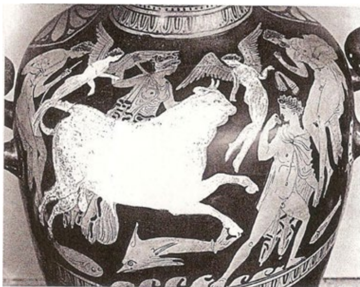
Hydria attica a figure rosse, Londra, British Museum, E 231.