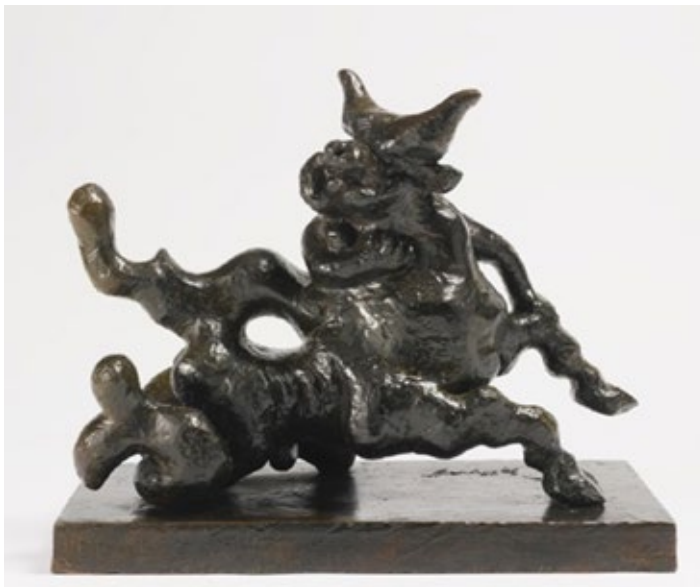
Il Ratto di Europa di Jaques Lipchitz, 1941.

Il risultato è Il Ratto di Europa di Jaques Lipchitz, 1941, opera che racconta la lotta contro il nazismo e il suo tentativo di compiere un ratto d'Europa, inteso come conquista ed espropriazione sanguinosa del Continente. Qui Europa combatte contro il suo violentatore (Hitler) e cerca di ucciderlo. La cieca violenza del toro sopraffattore è visualizzata dalla sua degenerazione mostruosa nel Minotauro, che riverbera il ricordo del pesante tributo di 14 giovanetti pagati al suo triste pasto annualmente dagli Ateniesi.