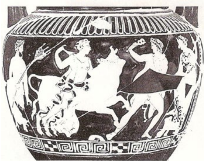
Cratere a colonnette attico a figure rosse, Ferrara, Museo Nazionale, 2425; rinvenuto a Spina. Inizi IV sec. a.C.

Il tema è rappresentato anche nell'hydria attica a figure rosse del 370 a.C., opera del cosiddetto Pittore di Europa 21 :