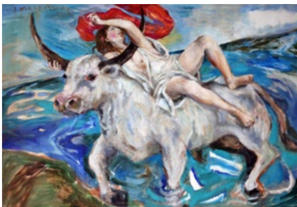
Młodożeniec Stanisław, Il ratto di Europa (quadro della collezione privata).