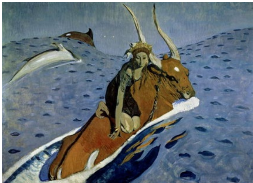
Valentin Serov, Il ratto di Europa , 1910.

Il quadro rappresenta quella svolta verso la mitologia, intesa come sogno di una lontana giovinezza dell’uomo, nella quale Serov ha cercato, negli anni pesanti della reazione, la distrazione dalla sconfitta della rivoluzione del 1905 che tanto lo sconvolse.