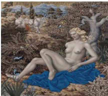
Werner Peiner, Europa und der Stier del 1937.