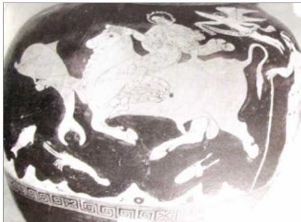
Anfora panatenaica lucana a figure rosse Londra, British Museum, F 184.

La scena è chiusa a sinistra da una Scilla con tridente e a destra da un Tritone, che meravigliati volgono lo sguardo verso il vertice di quello che è uno schema pentagonale, dove volteggia sopra la testa di Europa Pothos, simbolo del desiderio amoroso ricambiato e auctor dell'intera vicenda. Il tema erotico rimbalza anche dagli angoli superiori della cornice in cui il pittore ha dipinto un piccolo Eros e la dea dell'amore Afrodite, insieme al suo amato Adone, emblemi della passione amorosa. Ma già cinquant'anni prima il Pittore di Policoro aveva decorato un'anfora panatenaica lucana a figure rosse con la scena di Europa comodamente seduta sul toro