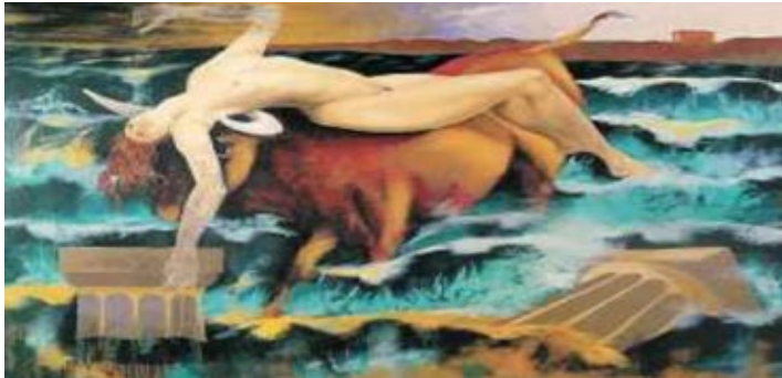
Simplicissimum, 20 dicembre 2012.

morire. Né valgono a trattenerla le corna del toro, falci bianche alle quali per la sua posizione supina mai la ragazza si è potuta appigliare.