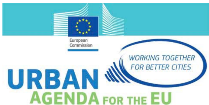
02 | Logo dell'Agenda Urbana Europea European Urban Agenda logo

Anche se quello della povertà urbana è un settore di competenza specifica delle Autorità Urbane, questo è quello in cui sono stati trovati approcci veramente rivoluzionari anche se sempre basati su esperienze precedenti. È il caso di Barcellona che sperimenta e valuta sette schemi differenti di Reddito Minimo Garantito con diversi gruppi in uno dei quartieri più poveri della città; di Lille e Nantes, il cui collegamento tra i progetti è dato dal tentativo di utilizzare approcci tradizionali di tipo territoriale per introdurre funzioni urbane innovative (centro per i senzatetto a Nantes e cluster per la produzione e il consumo di cibo a Lille); di Birmingham che offre una mappatura del patrimonio locale per cercare di collegarlo con importanti investimenti pubblici (nuovi ospedali) e privati (sviluppo immobiliare) già previsti per una zona povera della città; di Torino che offre una dimensione concreta alla propria regolamentazione dei Beni Comuni. Nello specifico il progetto CO-CITY di Torino è destinato a rompere il circolo di auto rafforzamento della povertà, della polarizzazione socio-spaziale e della mancanza di partecipazione attraverso lo sviluppo di un innovativo sistema policentrico che si fonda sulla valorizzazione dei Beni Comuni, sulla coproduzione a basso co-