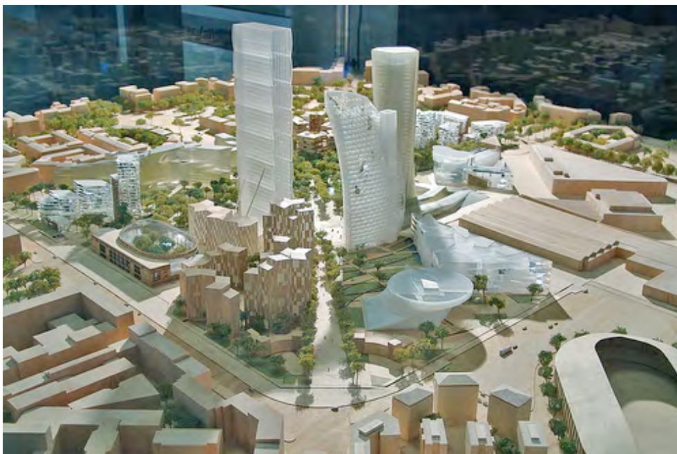
Fig. 2 Modello Expò 2015, Milano