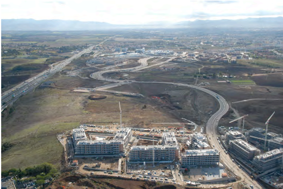
Fig. 1 Progetto Urbano Bufalotta, Roma, Vista sud - nord, 2007