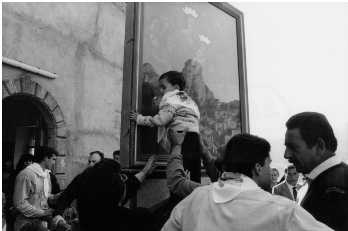
Figura 8. Pentedattilo (Reggio Calabria).