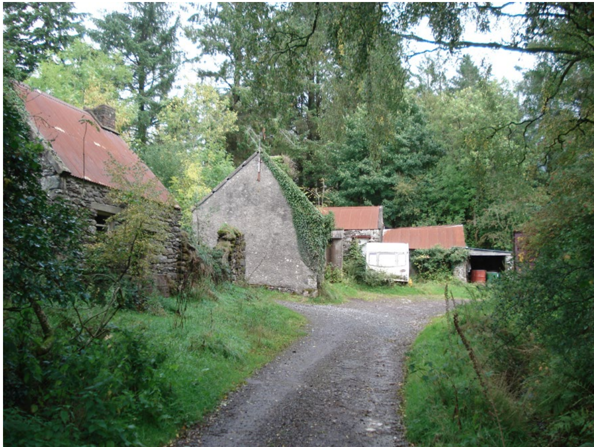
Figure 1. The remnants of “the city”, Nire Valley, County Waterford.