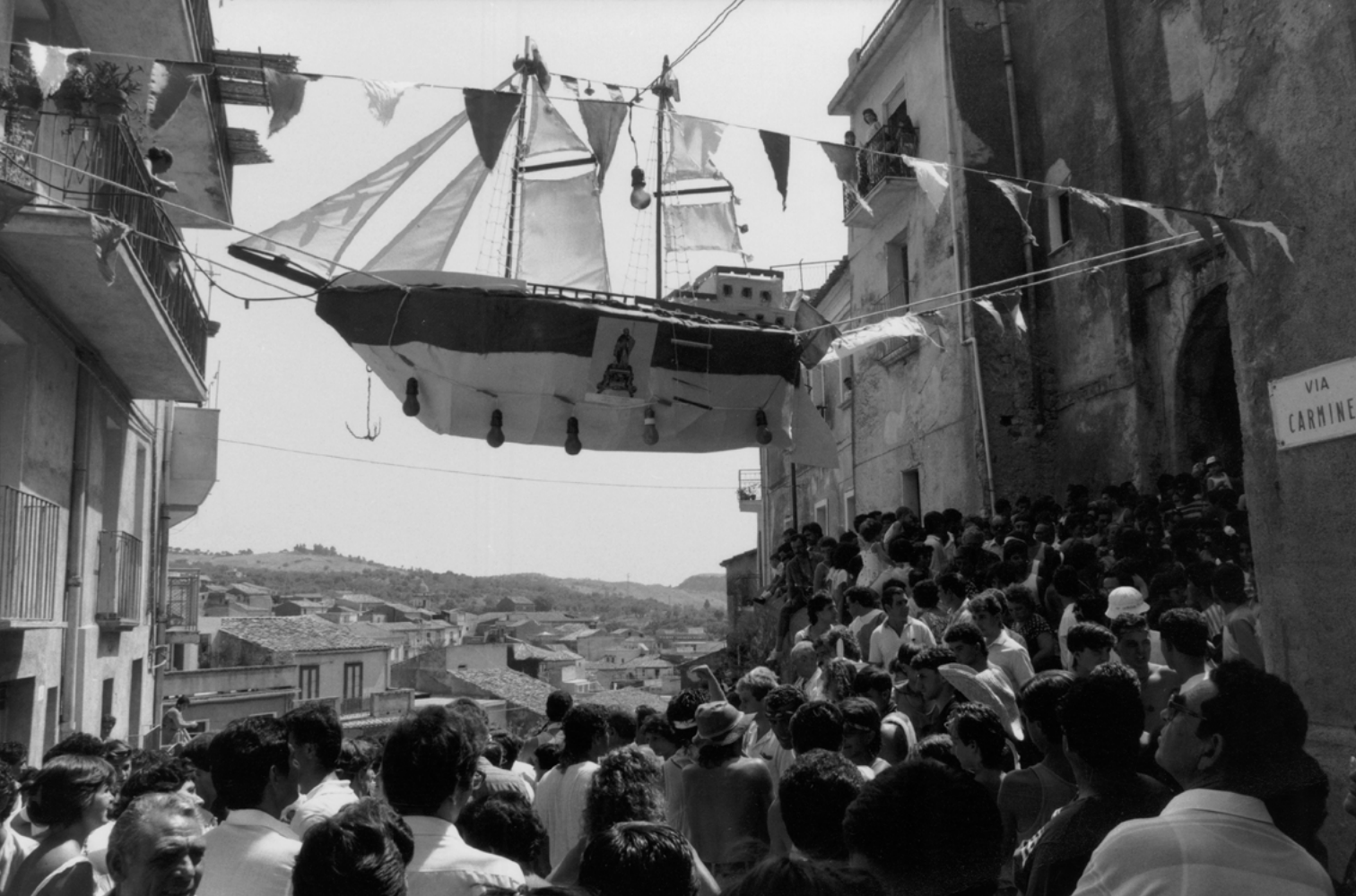
Figura 3. Gioiosa Jonica (Reggio Calabria). Festa di San Rocco (foto V. Teti, 1986).