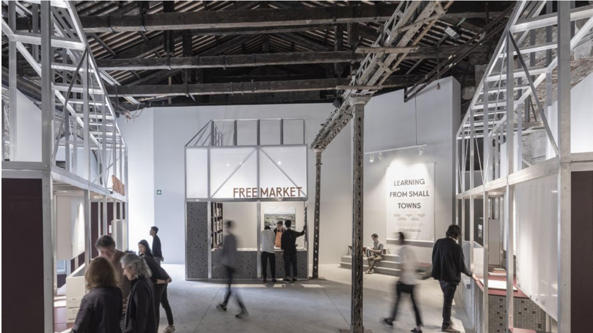
Figure 4. Free Market: the Irish pavilion at La Biennale di Venezia 2018.