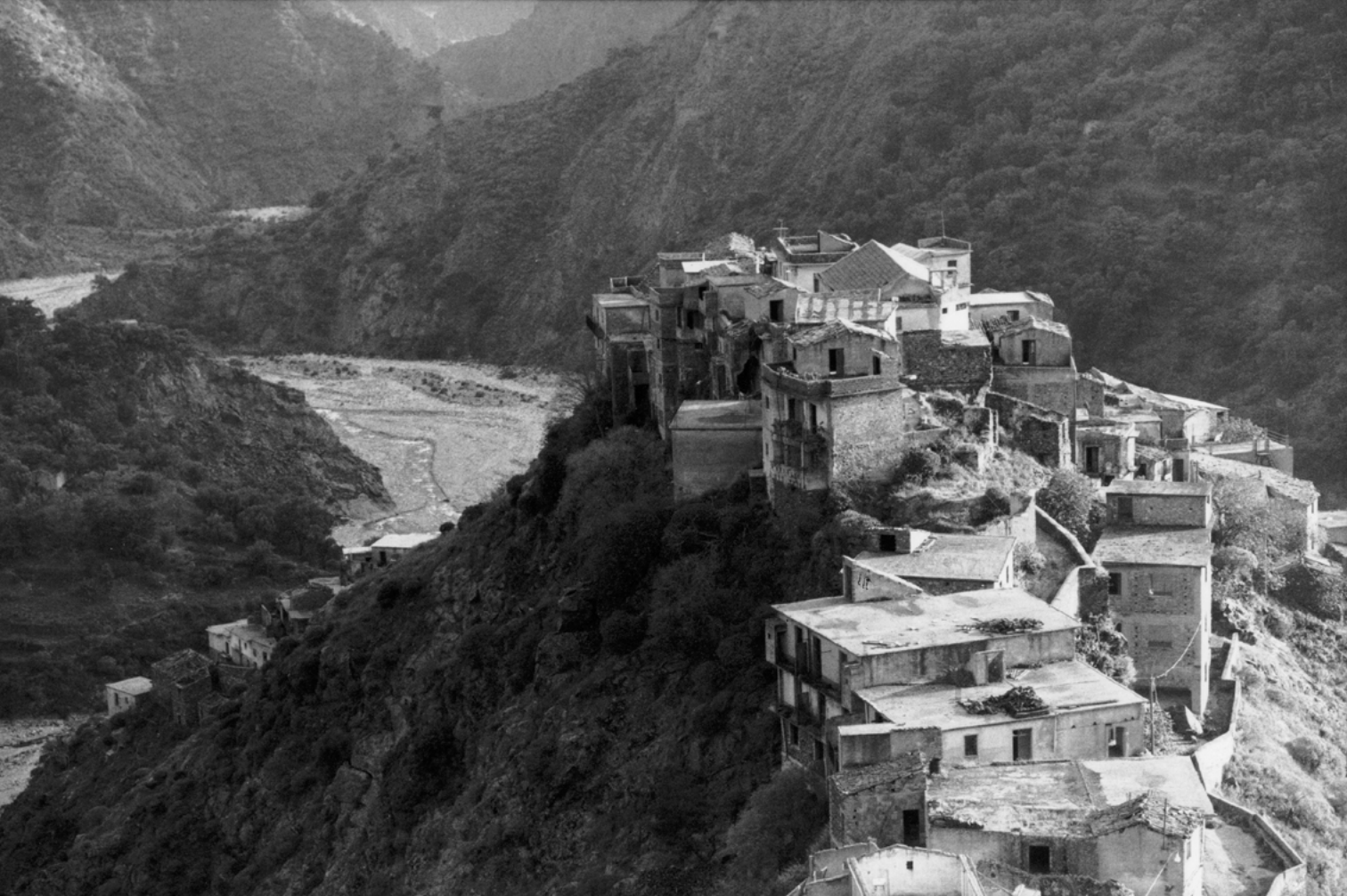
Figura 5. Roghudi (Reggio Calabria) (foto V. Teti, 2003).