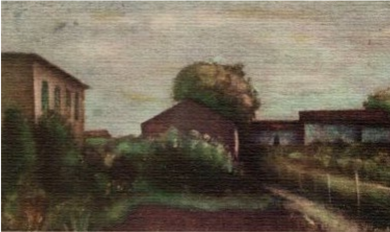
Figura 1. Carlo Carrà, Orti Toscani (1928), particolare dell'illustrazione per la copertina dell'edizione di La luna e i falò del 1950 (da C. PAVESE, La luna e i falò , Einaudi, Torino 1950).

Questo richiamo all'onomastica è per accennare ad un ripetuto sondaggio in occasione degli esami di Analisi della città e del territorio , corso che ho tenuto al Politecnico di Torino dopo il trasferimento dallo IUAV. Grandi città ed aree metropolitane in Italia 4 di Alberto Aquarone, uno dei testi da presentare, tratta approfonditamente il caso torinese e così offriva spunti per fare riferimenti alle vicende migratorie dei nuclei familiari originari: da quali località del Nord Est provenivano, in che anni e per quali ragioni le avevano abbandonate; in quali zone del Piemonte erano approdate e successivamente si erano spostate; quali i mestieri a seconda delle occasioni di lavoro in una fase di intensa crescita economica e così via: in altre parole se erano andati oltre le pagine del libro per cogliere dal vivo la grande ondata migratoria che aveva investito il Piemonte nel Secondo dopoguerra.