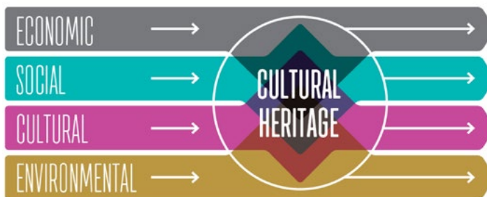
FIGURE 4.3. "UPSTREAM" PERSPECTIVE ON CULTURAL HERITAGE IMPACT