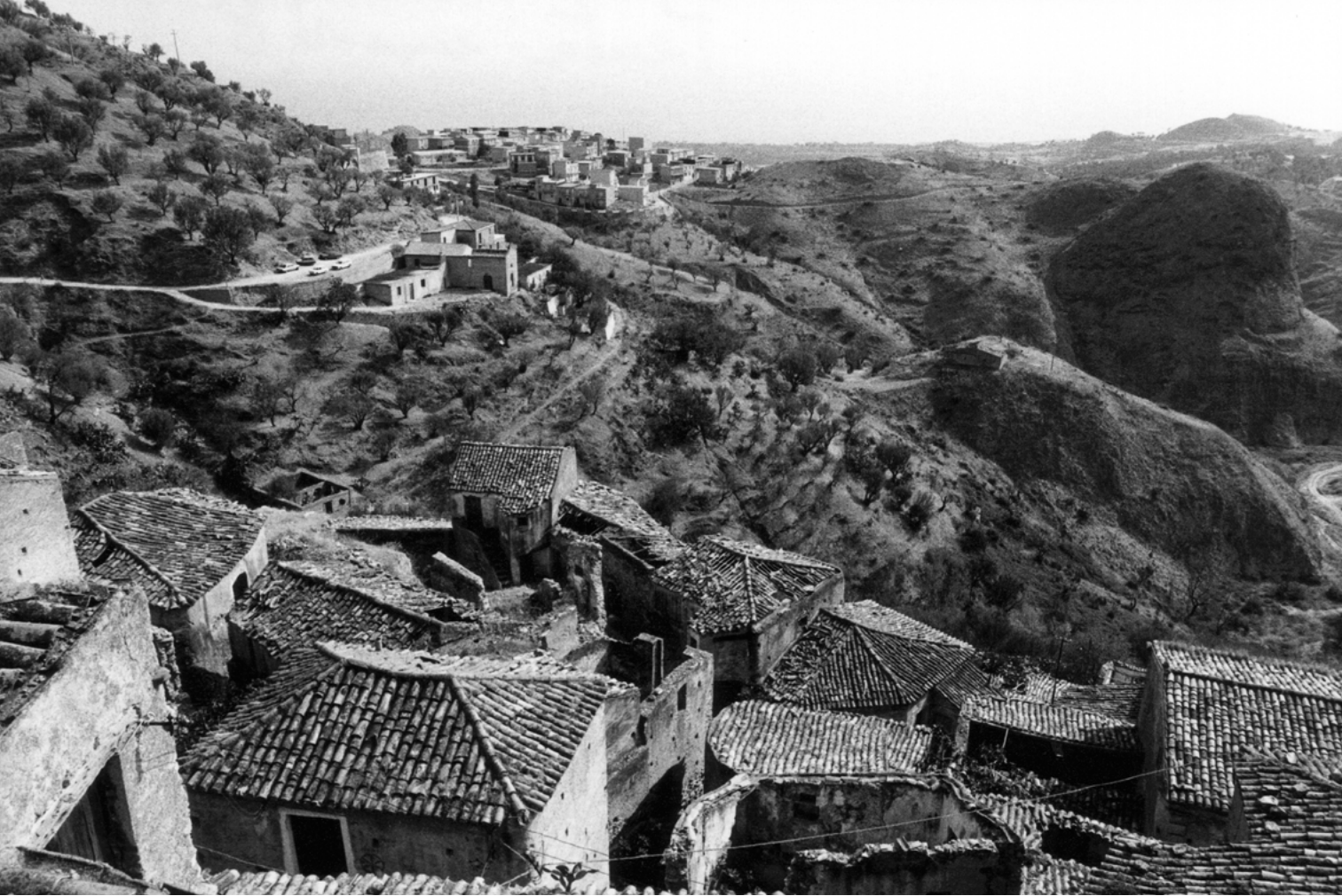
Figura 9. Pentadattilo (Reggio Calabria).