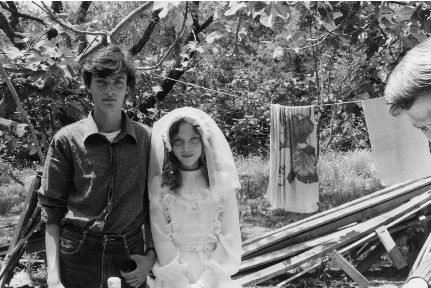
Figura 7. Campagne di San Nicola da Crissa (Vibo Valentia) (foto V. Teti, 1985).