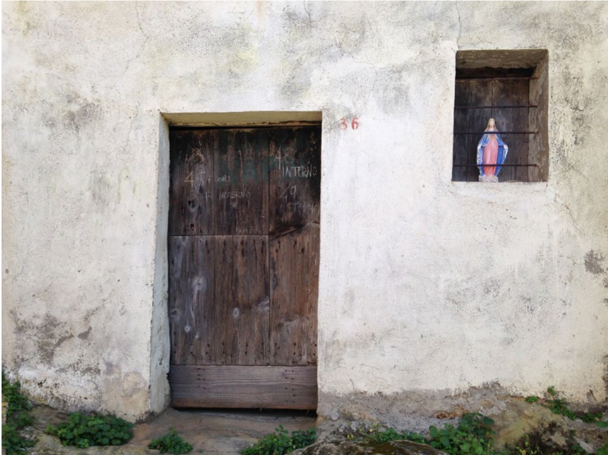
Figure 3. Ferruzzano (Reggio Calabria), view of the entrance of an abandoned building (photo N. Sulfaro, 2019).

On the next page, figure 4. Ferruzzano (Reggio Calabria), view of an abandoned house interiors (photo N. Sulfaro, 2019).