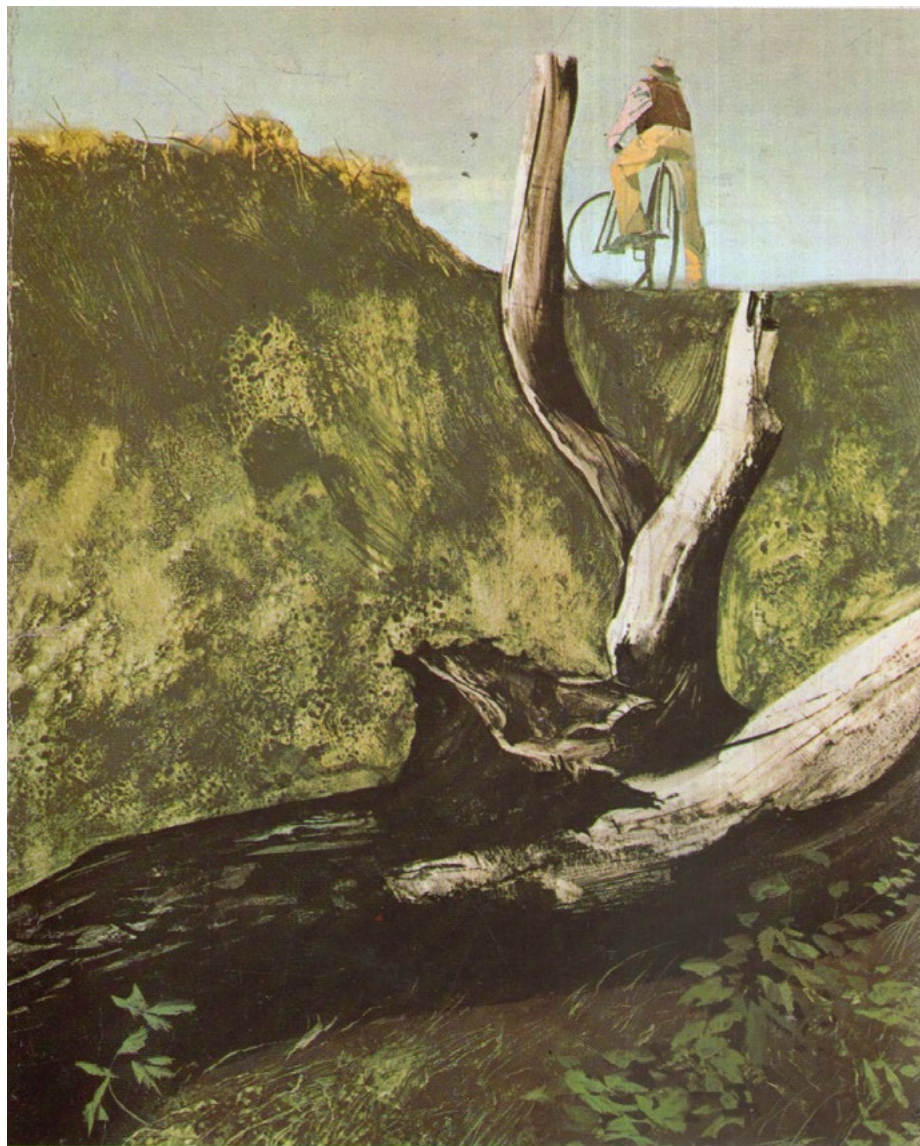
Figura 2. Mario Tempesti, illustrazione per la copertina dell'edizione di La luna e i falò del 1964 (da C. PAVESE, La luna e i falò , Oscar Mondadori, Milano 1964).