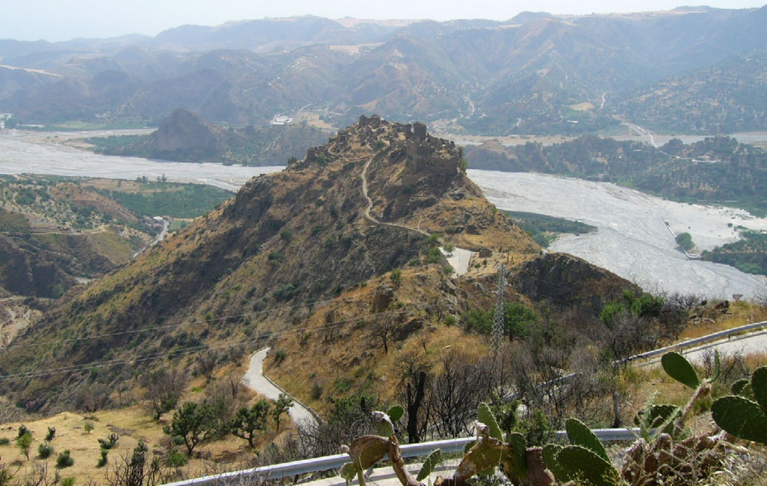
Figura 3. Amendolea Vecchia (Reggio Calabria). Il borgo antico sullo sfondo dell'omonima fiumara. Gli ultimi abitanti del paese, già spopolato, dopo l'alluvione del 1956 furono trasferiti nel nuovo piccolo borgo ricostruito ai piedi della rocca, https://mapio.net/images-p/17861057.jpg (ultimo accesso 18 settembre 2020).