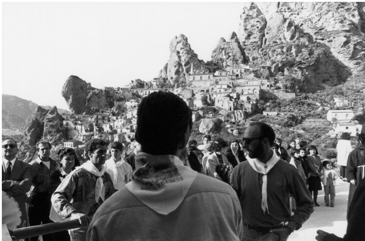
Figura 1. Pentadattilo (Reggio Calabria). Madonna di porto Salvo.