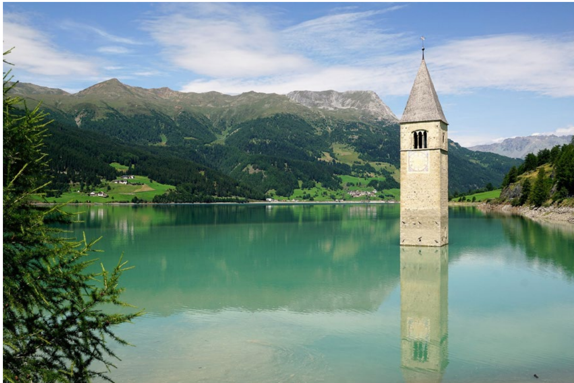
Figura 2. Curon (Bolzano). Ciò che resta dell'antico borgo, sommerso nel 1950 dal lago artificiale di Resia. L'iconico campanile che emerge dal lago è oggi una delle attrazioni del nuovo omonimo abitato, costruito più a monte, dove la popolazione fu obbligata a spostarsi, https://www.maxpixels.net/photo-2612296 (ultimo accesso 18 settembre 2020).