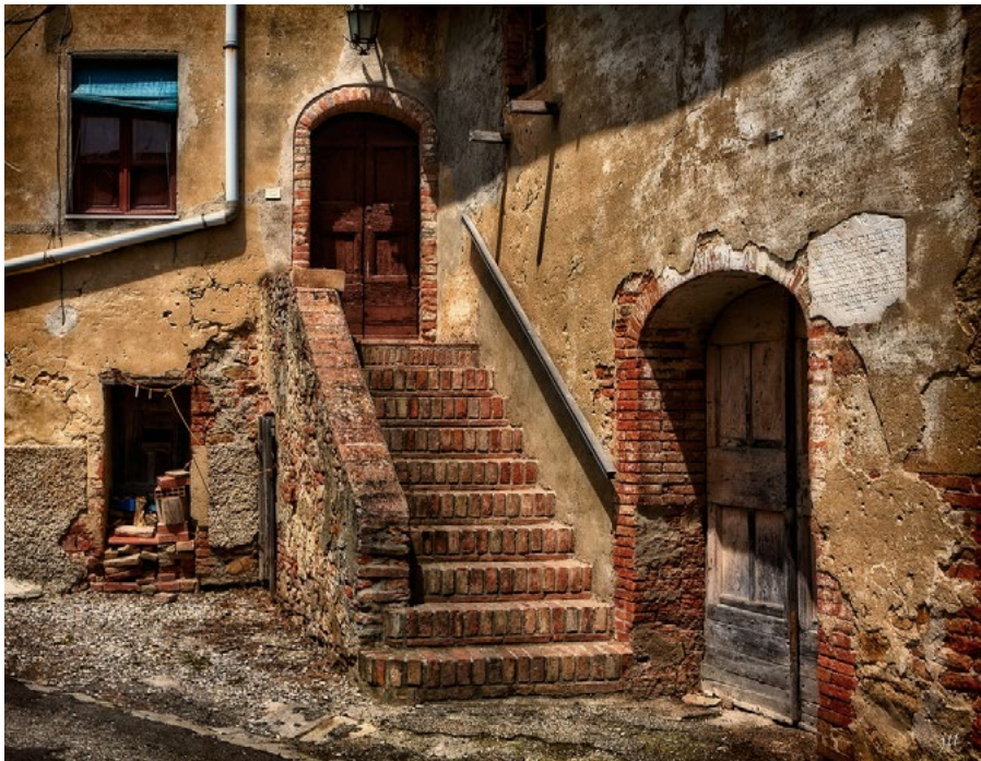
Figura 4. Toiano (Pisa). Il borgo, oggi attualmente spopolato iniziò la sua decadenza nel XIX secolo. Il borgo oggi è noto, grazie all’iniziativa di Oliviero Toscani che gli dedicò un concorso fotografico, finalizzato alla sua valorizzazione, https://www.visittuscany.com/shared/visittuscany/immagini/blogs/idea/toiano.jpg (ultimo accesso 18 settembre 2020).

umane “programmate” – eventi bellici, politiche di gestione del territorio, fragilità socio-economiche – indicandone quindi l’incidenza sugli andamenti demografici. Si tratta, però di una generalizzazione statistica che, pur capace di dare immediatamente un quadro chiaro e inequivocabile delle dimensioni del fenomeno, appare non del tutto adeguata alla sua comprensione. È evidente, infatti come non è possibile ricondurre il tutto a una singola causa, per quanto incidente possa apparire, così come non è possibile ragionare su una “policasualità orizzontale” 14 , che non tenga conto del momento di innesco e dell’evoluzione delle singole dinamiche, oppure che trascuri le specificità delle tipologie insediative e dei rapporti geo-storici locali.