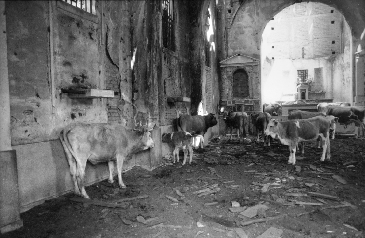
Figura 2. Africo Vecchio (Reggio Calabria).