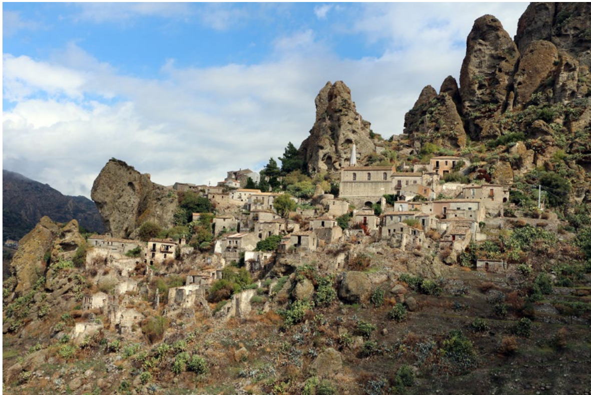
Figura 6. Pentadattilo (Reggio Calabria). Veduta.