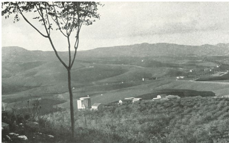
Figura 5. Borgo Gigino Gattuso (Caltanissetta) nel 1941, un anno dopo il completamento. Il borgo, progettato dall'architetto Edoardo Caracciolo, è uno degli otto centri rurali realizzati dal regime fascista in Sicilia (da AJROLDI 2020).

spersonalizzazione, alienazione e diserzione, in progettazioni monotone e ripetitive, prive di elementi di riconoscibilità o poli aggregativi identitari. Esiste un'ampia casistica di insediamenti abbandonati già poco dopo la loro fondazione, magari ancor prima di venire ultimati sul piano edilizio, quelli che in tedesco vengono detti Fehlsiedlungen , "insediamenti mancati", incapaci di attrarre un numero sufficiente di abitanti o progettati tenendo in maggior conto i caratteri celebrativi piuttosto che quelli funzionali.