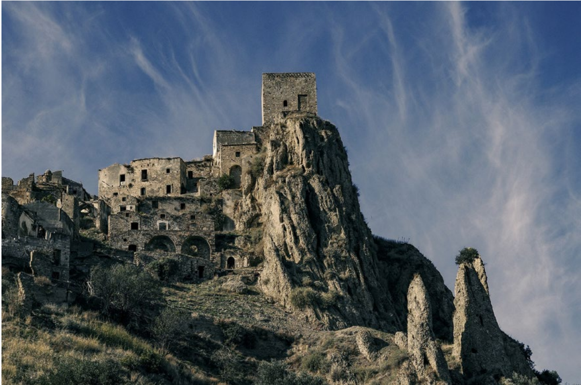
Figura 1. Craco (Matera). Il borgo, svuotatosi a causa di una frana negli anni sessanta del Novecento, è una delle immagini-simbolo dell'abbandono dei borghi storici.