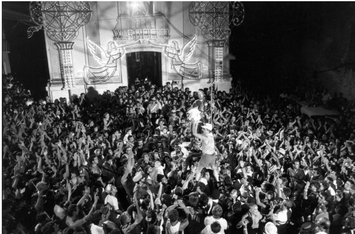
Figura 6. Gioiosa Jonica (Reggio Calabria). Festa di San Rocco.