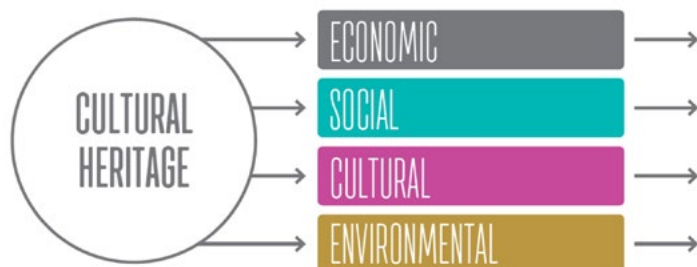
FIGURE 4.2. "DOWNSTREAM" PERSPECTIVE ON CULTURAL HERITAGE IMPACT