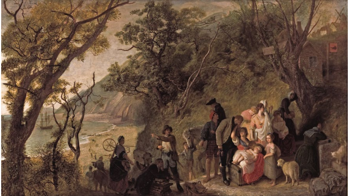
Figure 2. Joseph Severn (1793-1879) The Deserted Village , oil on canvas laid on wood, Art Gallery of South Australia, https://commons.wikimedia.org/wiki/File:Joseph_Severn_-_The_deserted_village_-_Google_Art_Project.jpg (accessed 10 June 2020).

made through reorganisation of the agricultural economy: an expression of aesthetic melancholia as much as a critique of the undermining of the established life of rural settlements.