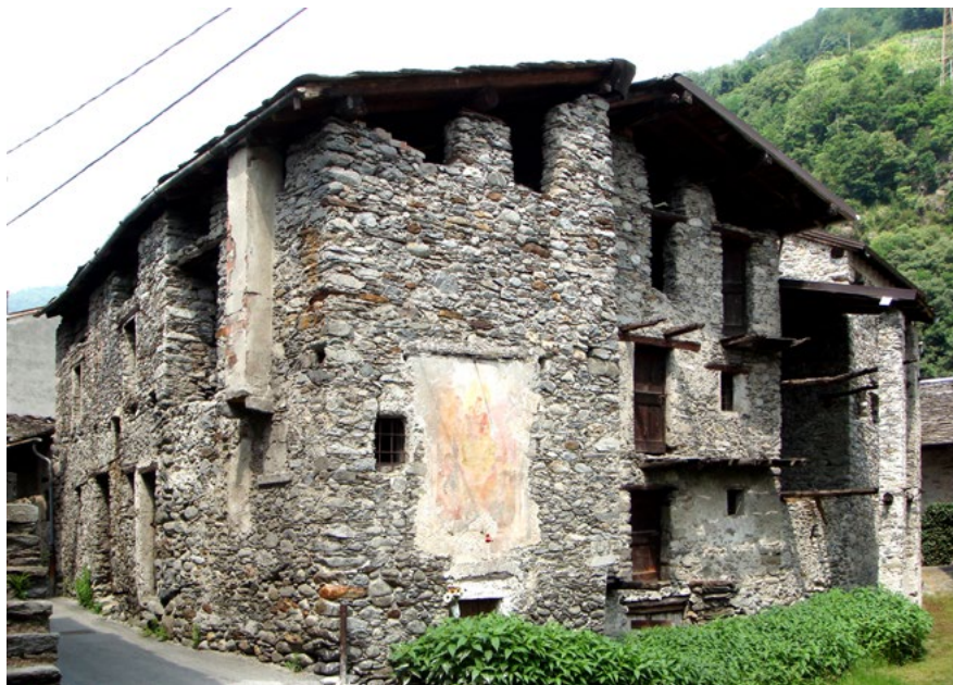
Figura 1. Ardenno (Sondrio), Case del nucleo al Piano (foto S. Della Torre, 2010).

adagiato nel fondovalle 8 . Qui le case sono rimaste vuote non per abbandono del luogo, ma perché tipologicamente obsolete. Quando l'Amministrazione comunale ci chiese un progetto per modificare le previsioni di piano, la nostra attività di ascolto attivo e partecipazione finì per verificare che il nucleo era riconosciuto come interessante, e come una opportunità progettuale, solo dalle élite e non dalla maggioranza degli abitanti. L'idea, di cui pur riconosco la banalità, di utilizzare le case abbandonate per una sorta di ostello diffuso, approfittando della opportuna collocazione rispetto ad un nuovo e strategico percorso ciclopedonale 9 , incontrò un generale scetticismo, salvo che in una ristretta cerchia di professionisti aggiornati, ovvero un imprenditore e il suo architetto di fiducia, che già avevano recuperato edifici analoghi per farne un agriturismo di successo, una vigna, e così via, sempre puntando su un marketing legato al concetto di autenticamente locale. Molti membri della