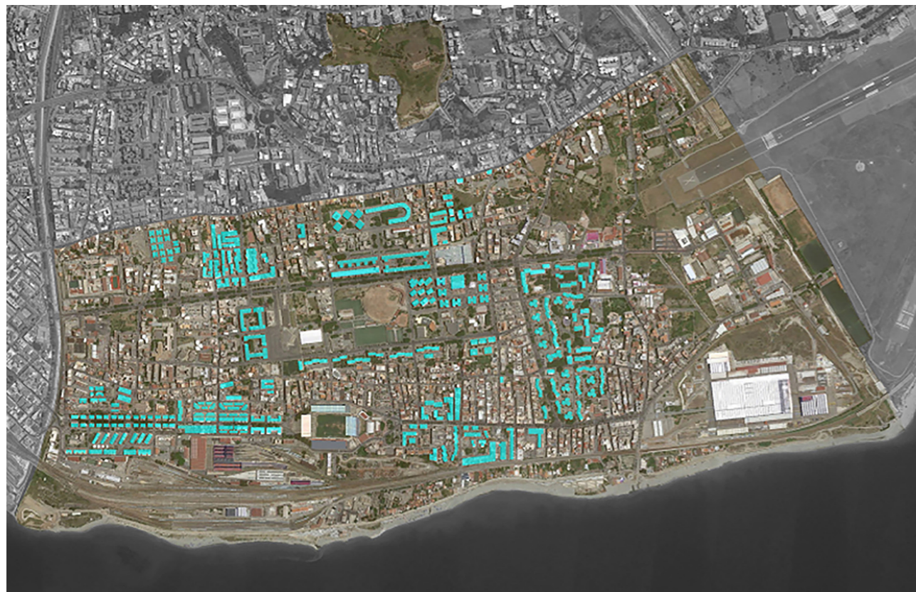
Figura 2: La distribuzione dei quartieri di edilizia pubblica realizzati ad opera dell'Ente Edilizio Comunale da Istituti e Enti statali (Iacp, Ina Casa, Gescal e , tra gli anni '60 e '80) e infine quelli realizzati negli anni '90 con il Decreto Reggio, Legge Speciale n. 246/1989.

Queste premesse per chiarire la scelta, nell'ambito della ricerca Criteri e metodi per ripensare i luoghi comunitari pro-benessere delle realtà urbane della Città Metropolitana di Reggio Calabria , di considerare, come metodo speditivo di prima valutazione degli spazi, quanto i luoghi esprimono durante il giorno, nelle ore serali e notturne, nell'arco delle stagioni. I luoghi non sanno mentire, ad una attenta osservazione dimostrano scarsa vitalità, usi impropri, inidoneità alla sosta ricreativa e contemplativa, mancata ombreggiatura o riparo alle intemperie, espressione di squallore e insicurezza,