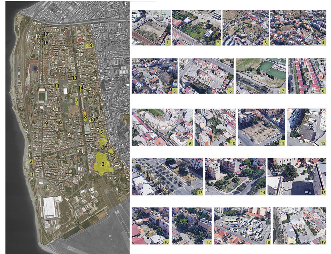
Figura 4: Gli spazi urbani potenzialmente idonei a rappresentare un rafforzamento della rete degli spazi di relazione e dei nuovi luoghi di attesa in quartieri che ne risultano carenti.

anche se questi luoghi si trovano a poche centinaia di metri dalla Stazione Centrale. Meriterebbe un impegno dedicato e finalizzato a creare occasioni sistematiche di rigenerazione urbana, con obiettivi di conferimento di senso e di dignità in una logica di sistema perché, pur esistendo brani di qualità, sembra mancare il coinvolgimento del ruolo di tutti i quartieri. La ricerca di come ottenere un rinnovato spazio vitale ha posto alcune domande di base che possono sembrare ovvie tra coloro che si occupano di territorio e di città ma che ancora stentano ad ottenere risposte plausibili nei tentativi di migliorare le condizioni fisiche e le relazioni. Quali criteri, metodi, strumenti e risorse servono per progettare, realizzare e mantenere, una rete connettiva composita tra rete ecologica