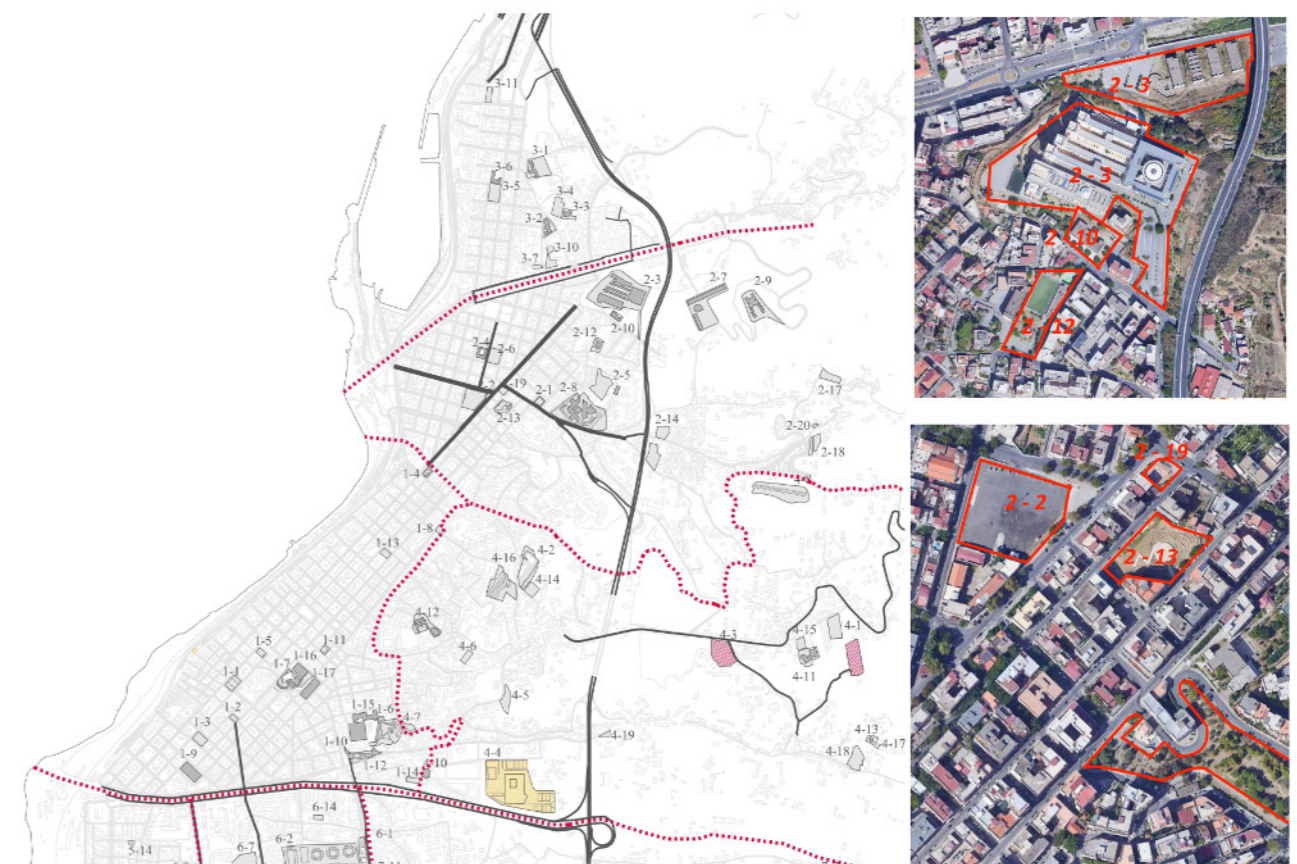
Figura 3: I luoghi sicuri della città di Reggio Calabria. Il sistema composto dalle aree di Ammassamento, aree di Ricovero, aree di Attesa, quest'ultime da raccordare e validare rispetto ai percorsi "sicuri" che consentono di raggiungerle e alle porzioni di tessuto urbano, di cui hanno il compito di accogliere gli abitanti insediati. Fonte: a sinistra M. Umbro, 2013; a destra Schede di dettaglio Piano Protezione Civile di Reggio Calabria, 2008, rielaborazione dell'autore.

assenza o incostante manutenzione degli elementi di naturalità. Alla valutazione critica di quello che esprime il luogo per la comunità nella realtà attuale si integra la documentazione del vissuto di quel luogo, delle sue alterne fortune perché nei suoi percorsi storici si potrebbero comprenderne i declini e rintracciare le gemme di una sua rinascita. Il metodo speditivo presuppone letture sintetiche consentite da elevate capacità progettuali, e scrupolosamente documentate da immagini e considerazioni "tracciabili" per nuovi step di lavoro ma, anche, al fine di consentire immediate confutazioni. Un approccio analitico è quello dedicato alla valutazione della corrispondenza tra luoghi, non solo spazi urbani aperti ma anche interi quartieri o porzioni di essi, con le condizioni di salute e le patologie documentate degli insediati. È stato pos-