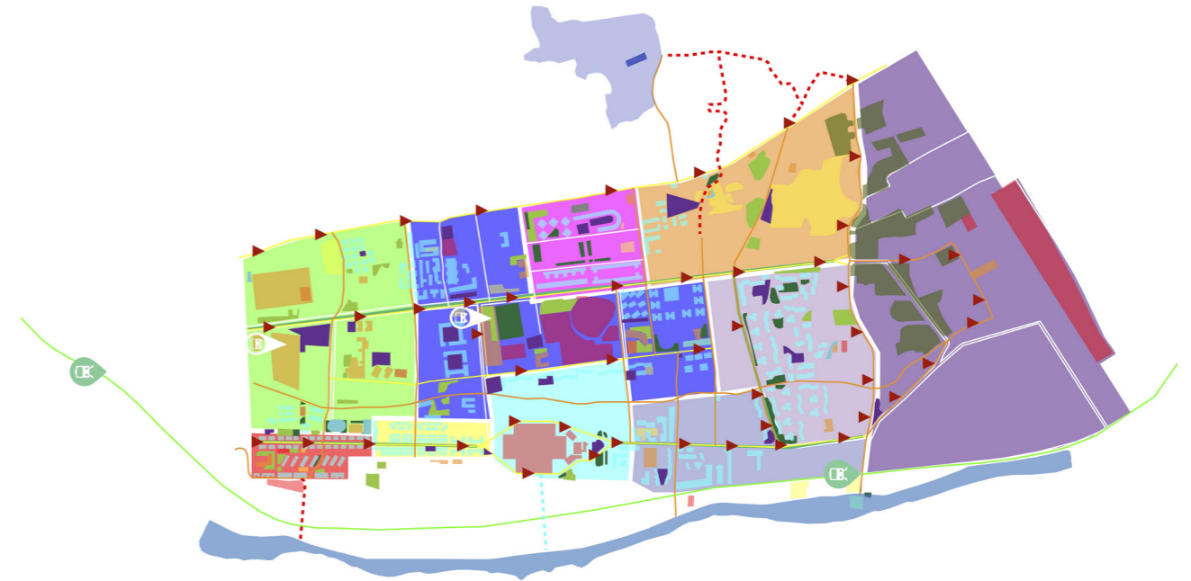
Figure 5: Hypotheses of consistency between population density, quantity and quality of services, relational spaces and safe places verified in the urban sub-units of the neighborhoods.

esting routes that make it pleasant and surprising to live in the city for crossings and stops that allow a sociability typical of meeting spaces but also silence, reflection and contemplation of small urban refuges with artistic-naturalistic value but especially mitigation of any heat islands.