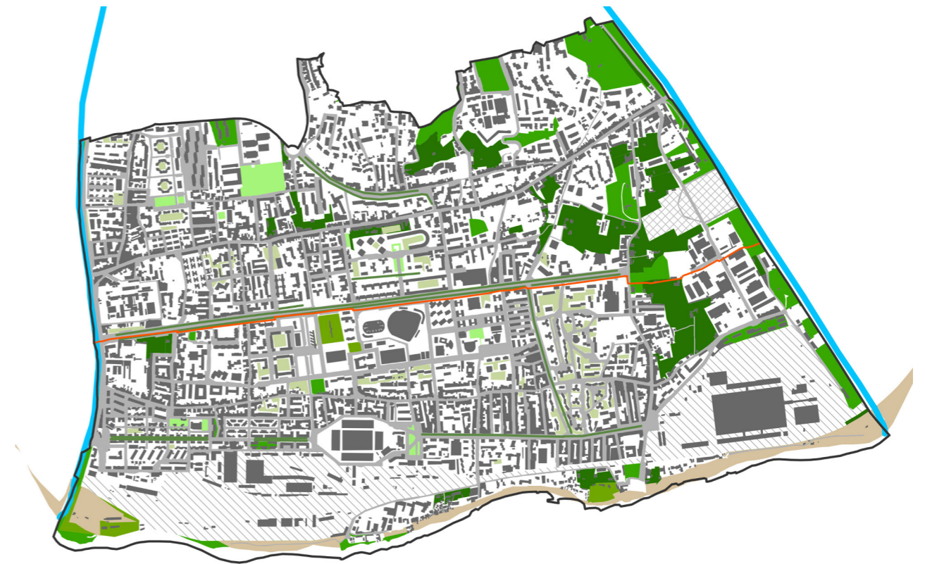
Figure 1: The system of green areas in the southern part of the city of Reggio Calabria. The small parks, the gardens, the tree-lined avenues constitute the first elements of the potential permeable network that could connect the agricultural and wooded areas and the uncultivated areas of the peri-urban belt. The South Linear Park, the regimented torrential banks of the Calopinace and Sant'Agata streams, the residual areas of the ancient Botanical Garden and the large hilly area of the former powder magazine represent the valuable elements of the eco-naturalistic connective network.

These premises clarify the choice, in the context of the research Criteria and methods for rethinking pro-wellbeing community places in the urban realities of the Metropolitan City of Reggio Calabria, to consider, as a quick method of initial evaluation of the spaces, what the places express during the day, in the evening and at night, and throughout